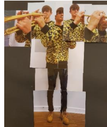
Zwei Beispiele der gemeinsamen Arbeit zum Thema Fotografie (Kollagen, nach einer Idee des Künstlers David Hockney)

Wenn wir uns zum Beispiel mit dem Thema Farbe beschäftigen, dann wird in Kunst die Farblehre betrachtet, mit Farben analog gemischt und gemalt, oder es können auch digital am Computer Bilder erstellt werden. In Physik hingegen wird die Farbe auf ganz andere Weise untersucht. Wieso sehen wir unterschiedliche Farben? Wieso ist der Himmel blau und ein Sonnenuntergang rot? Wie entstehen die Farben auf einem Computerbildschirm? Und was hat das alles mit Wellen zu tun?